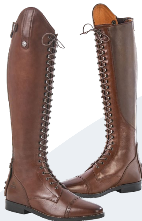
Maße in cm der Reitstiefel LAVAL, braun